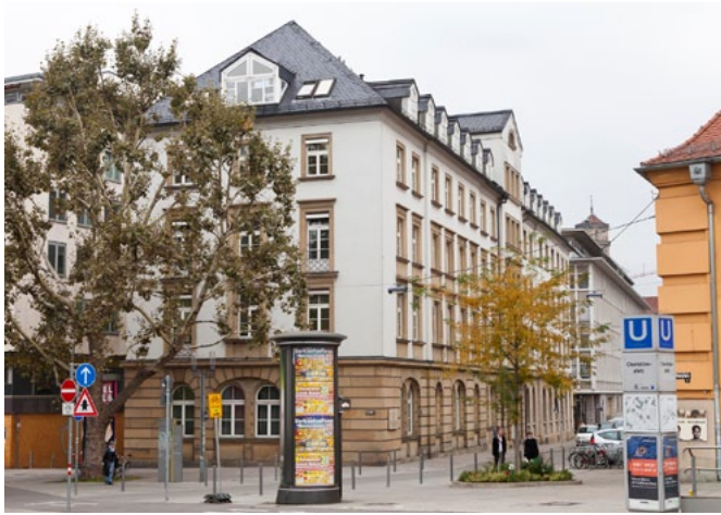
Das „Hotel Silber“ im Jahr 2013 vor dem Umbau