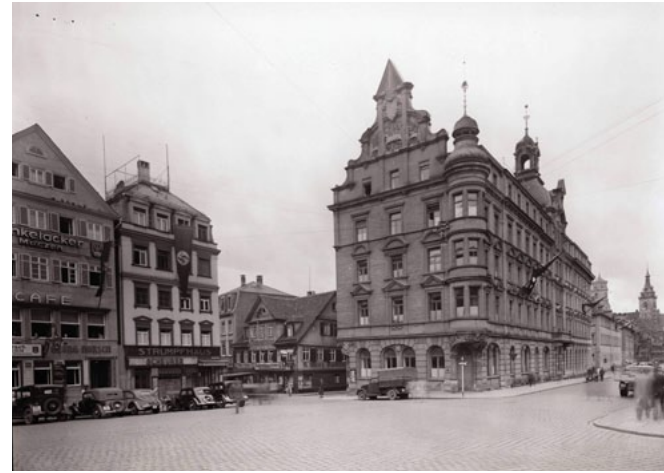
Die Gestapo-Zentrale in der NS-Zeit