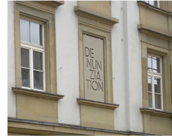
Einer der Titelbegriffe als Fensterverfremdung

Der Eintritt ins „Hotel Silber“ und zu allen Veranstaltungen der Eröffnungswoche ist frei.